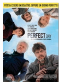
FILM: PERFECT DAY drammatico, 106 min - Spagna 2015

In un teatro di guerra, come quello dei Balcani, "fuori" significa rischio, pericolo, ma è anche l'unico luogo in cui è possibile portare aiuto, incontrare l'altro, porre un gesto di pace e di riconciliazione. Qui i contrasti si fanno stridenti e le migliori intenzioni danno risultati disastrosi.