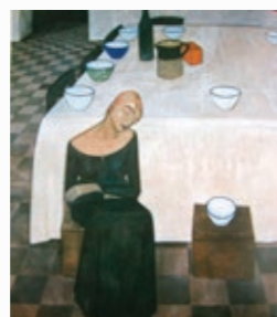
QUADRO: L'ATTESA Felice Casorati

L'assenza è l'occasione per crescere nell'attesa e nella gratitudine oppure per far valere la propria pretesa del tutto e subito. La donna con gli occhi chiusi custodisce il sentimento sospeso nel tempo vuoto come le tazze sul tavolo. Il suo grembo attende e si prepara alla pienezza.